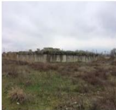
РЧВ 2х6000м 3