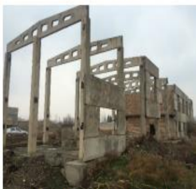
Здание реагентного хозяйства