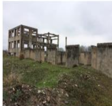
Здание песчаных фильтров