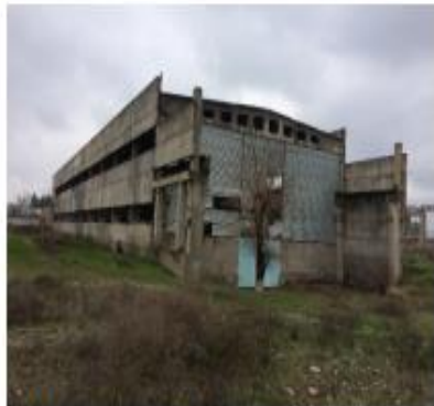
Насосная станция (снаружи)