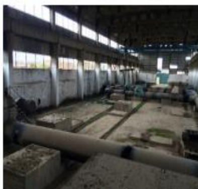
Насосная станция (изнутри)